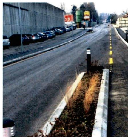
Ch. du Saux : Travaux terminés, revêtement définitif au printemps

Il reste encore des places à l' Éléphant Bleu dans le quartier des Saux, pour les enfants entre 2.5 et 5.5 ans. Trois matins et un après-midi par semaine. Contact : jardindenfant@gmail.com