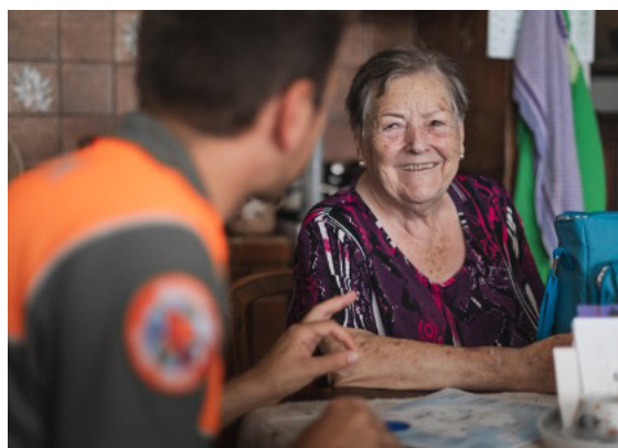
La PCI en action à Tolochenaz.

Ont participé à cette édition: Le greffe municipal et les membres de la Municipalité.